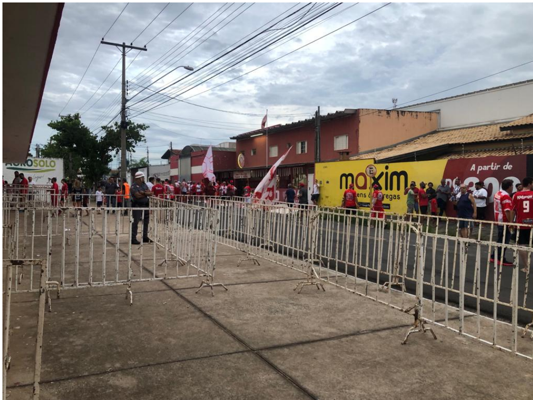
Figura 8: Padrão mínimo de instalação de gradis para controle de acesso e balizamento de público (IV)