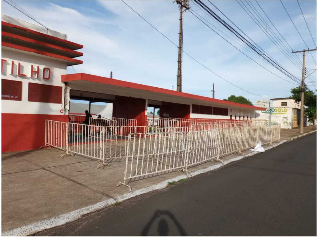
Figura 6: Padrão mínimo de instalação de gradis para controle de acesso e balizamento de público (II)