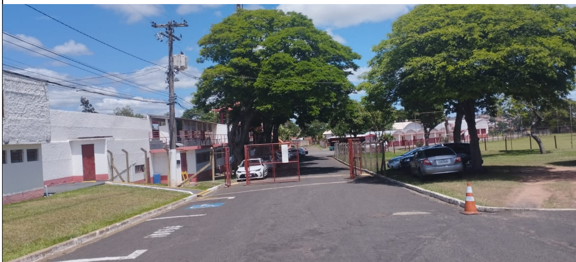
Figura 2: Acesso aos vestiários