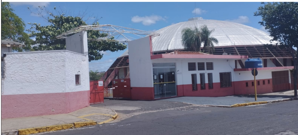
Figura 1: Portão H

A chegada das delegações fica vinculada ao planejamento do policiamento (principalmente no tocante à escolta), órgãos responsáveis pelo trânsito e outros, sendo observados, prioritariamente, os riscos para cada evento.