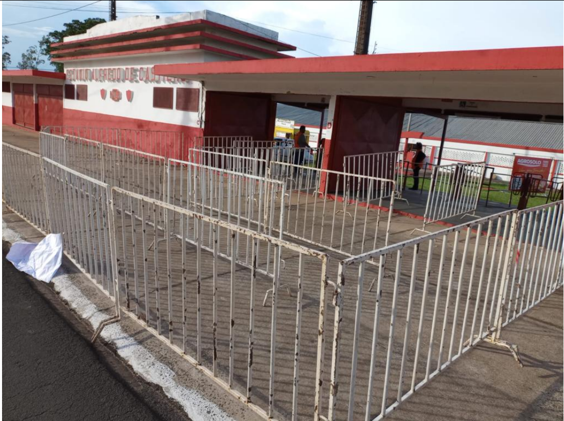
Figura 5: Padrão mínimo de instalação de gradis para controle de acesso e balizamento de público (I)