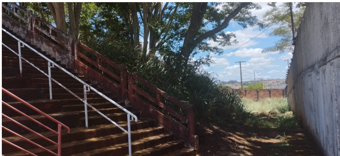
Figura 14: Escada de acesso ao setor 8

5.23 Existem pontos sensíveis onde possa ocorrer a entrada de objetos não autorizados no estádio? (armas, drogas, bebidas, alimentação, rojões, explosivos, etc.)