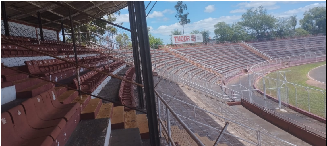
Figura 10: Barreiras fixas para separação de torcedores (II)