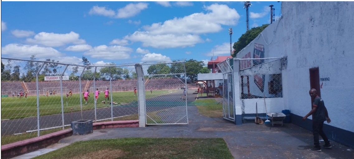
Figura 3: Portão de acesso ao Primeiro Setor

um portão com controlador de acesso para garantir o fluxo desobstruído em caso de necessidade de remoção de atletas.