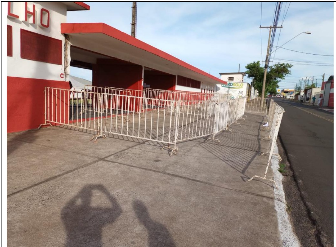
Figura 7: Padrão mínimo de instalação de gradis para controle de acesso e balizamento de público (III)