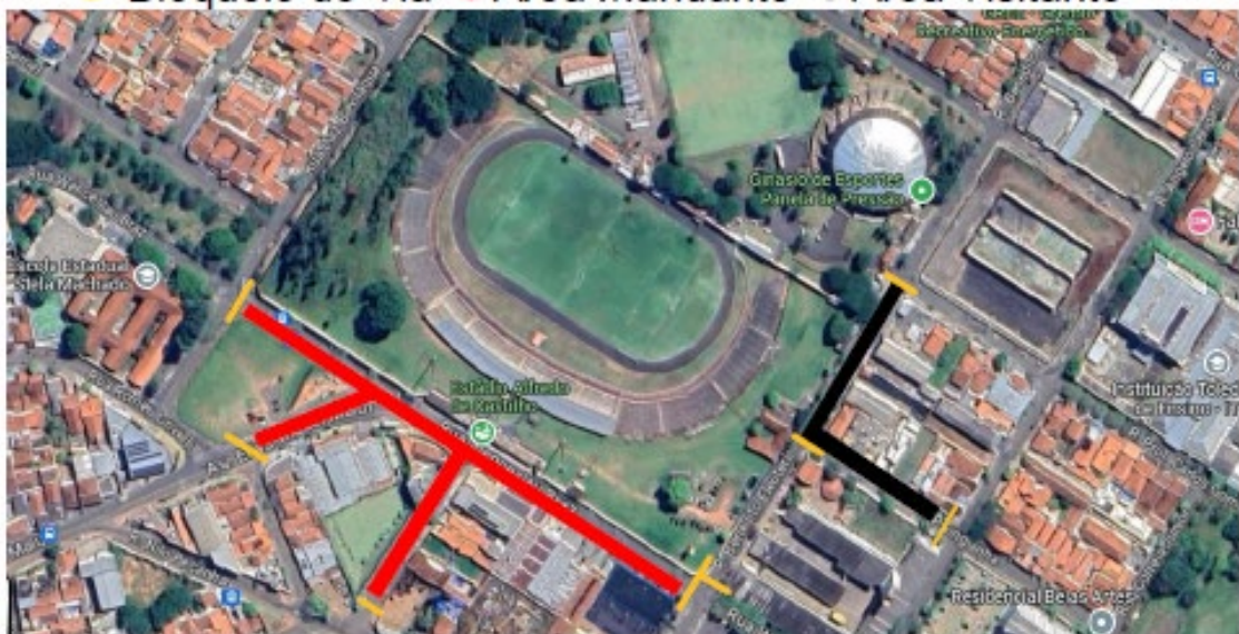
Figura 4: Mapa do entorno com vias de acesso

● Bloqueio de Via ● Área Mandante ● Área Visitante