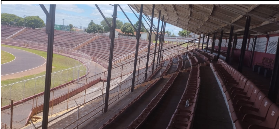
Figura 11: Barreiras fixas para separação de torcedores (III)

5.10 Quando móveis, as barreiras respeitam as vias de saída de emergência em relação à capacidade do setor?