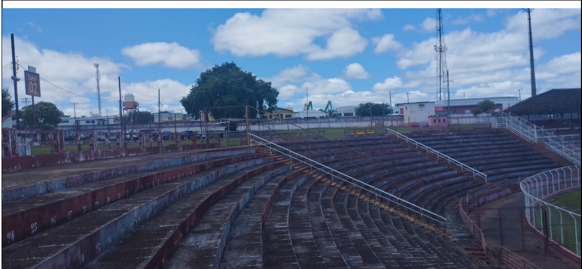
Figura 9: Barreiras fixas para separação de torcedores (I)