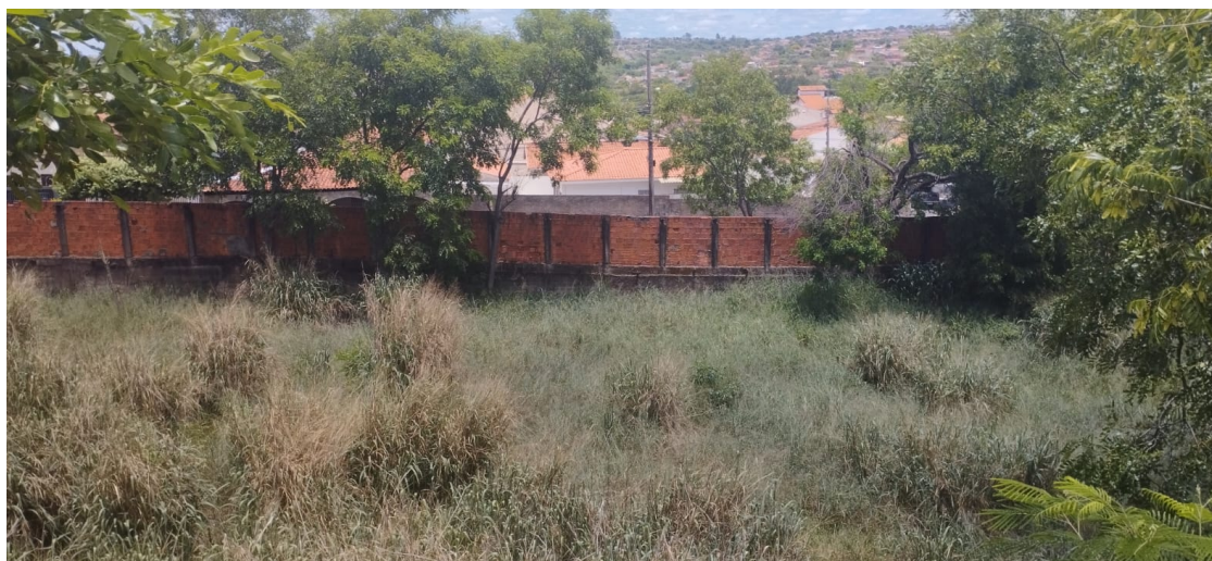
Figura 13: Muro lateral, rua Luiz Beviláqua (atrás dos setores 6, 7 e 8)

Sendo assim, faz-se necessária e imperativa a presença de orientadores/segurança privada com responsabilidade sobre tal área, para que, com o apoio de patrulhas da Polícia Militar possam coibir tal prática e evitar a invasão do estádio ou o acesso com materiais proibidos que possa, por consequência, comprometer a segurança da operação.